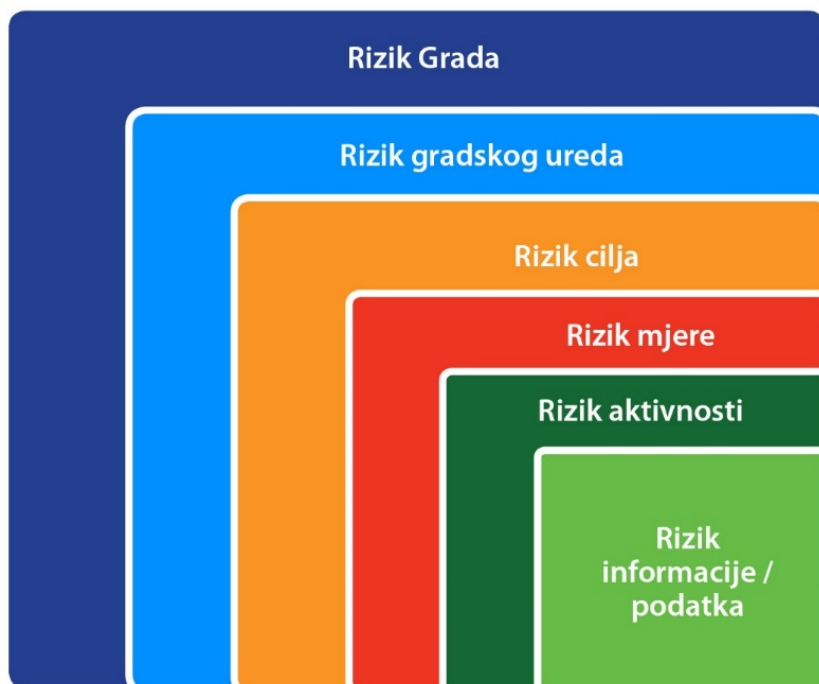
Slika 2 Područja rizika u implementaciji Strategije upravljanja imovinom

Svaka prikazana razina upravlja drugačijom kategorijom rizika, a strateškim rizicima upravlja jedino razina Grada preko gradonačelnika, kao odgovorne osobe, te se tako rizik Grada može povezati s kontrolnim okruženjem koje može utjecati na pojavnost rizika, odnosno na neprovođenje usvojene Strategije. Opredjeljenje gradske uprave da je Strategiju nužno provesti u djelo, umanjuje operativni rizik ne provedbe Strategije na nižim razinama (rizik gradskih upravnih tijela, rizik posebnih ciljeva, mjera i aktivnosti, pa sve do razine rizika na nivou podataka odnosno informacije).