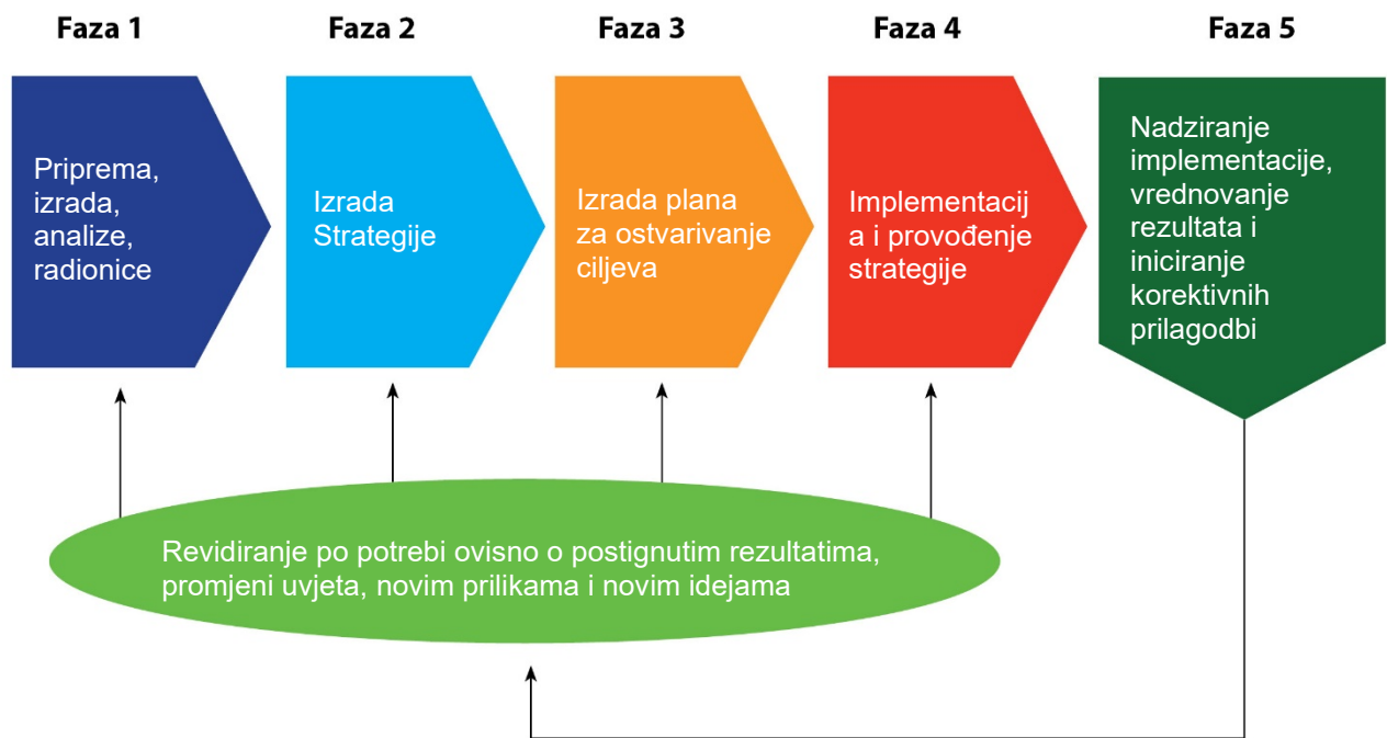
Slika 3 Područja rizika u implementaciji Strategije upravljanja imovinom